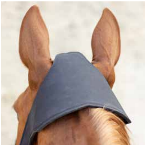
NeXaver Soft Touch