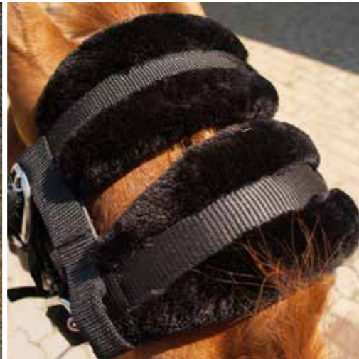
NeXaver „Faux Fur“